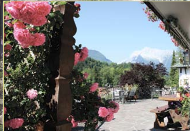
... alles pure Natur